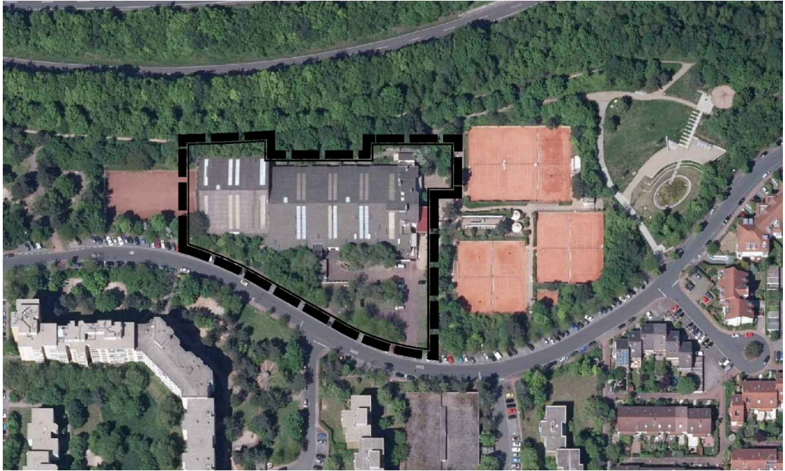
Abb. 2: Lage des Plangebietes innerhalb der Bebauungsstruktur (ohne Maßstab)