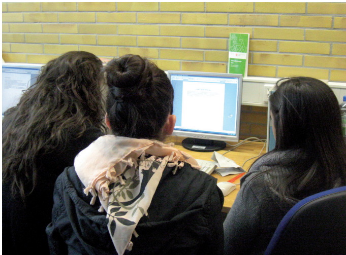
Girls' Day 2012 im Haus der Jugend

Auch 2012 unterstützte das Frauenbüro finanziell den Mainzer Mädchenkalender, der seit einigen Jahren vom Mädchenhaus FemMa e.V. herausgegeben wird.