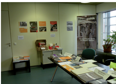
Tag der offenen Tür am 15. September 2012 im Rathaus