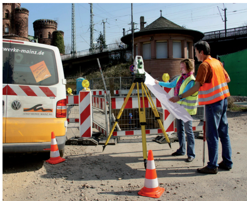
Absolventinnentag bei den Stadtwerken Mainz AG, 23. März 2012