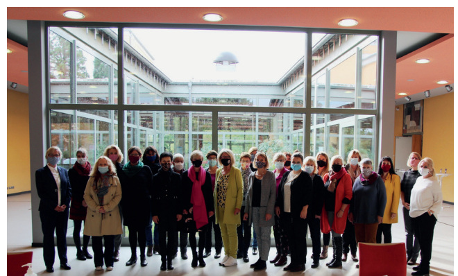
Teilnehmerinnen der LAG-Sitzung am 7. Oktober 2020 in Speyer.

Das Frauenbündnis traf sich analog und digital zu vier Sitzungen, der Landesfrauenbeirat zu drei Sitzungen. Auch in diesen Gremien standen die Auswirkungen der Pandemie auf unterschiedliche Gruppen von Frauen im Mittelpunkt. Aufgrund der Ende Oktober geltenden Corona-Schutzmaßnahmen ließ sich ein vom Frauenbüro und dem Frauenbündnis geplantes Fachgespräch über die »weibliche Seite der Krise« nicht realisieren.